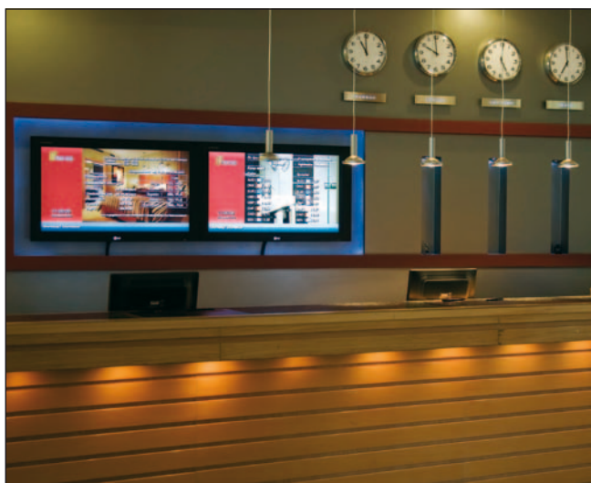
Die beiden Bildschirme an der Rezeption kamen im Zuge der Erweiterung des Systems Ende 2009 hinzu.