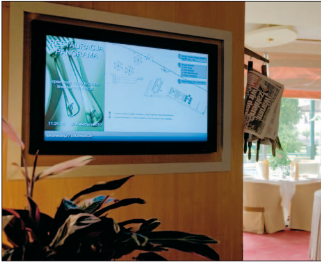
Der Touchbildschirm im Restaurant des HP Park Plaza Hotels