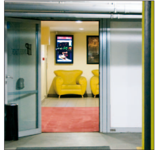
Auf dem Weg von der Parkgarage ins Hotel sieht man bereits von Weitem den Begrüßungsbildschirm.

19-Zöller in Aluminiumrahmen an Konferenzzimmern und dem Fitnessraum. Im Tagungsbereich können sich die Gäste an den Bildschirmen über den Zeitplan der Veranstaltung, die Mittagspause oder sonstige Inhalte informieren, die das tagende Unternehmen einspielt.